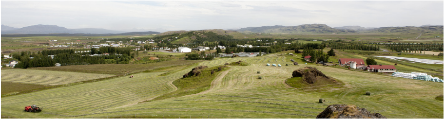
Hellisholt, Flúðir í bakgrunni.

6. Við myndun nafna skal fylgja íslenskum orðmyndunarreglum. Þannig getur nafn verið ósamsett orð eins og t.d. Hóll eða Hólar . Af þessu má svo mynda ýmsar samsetningar. Það sýna nöfn eins og Hólkot , Hólshús og Hólabrekka annars vegar, Grænhóll og Freyshólar hins vegar.