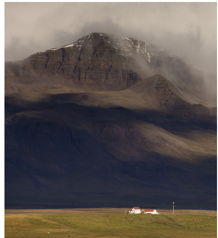
Galtarholt í Hvalfjarðarsveit.

Sérfræðingar á nafnfræðisviði Stofnunar Árna Magnússonar í íslenskum fræðum (áður Örnefnastofnun Íslands) veita sveitarfélögum og öðrum sem á þurfa að halda upplýsingar og gefa ráð varðandi nafnbreytingar býla. Á stofnuninni er enn fremur hægt að nálgast örnefnaskrár úr öllum landshlutum. Bæjanafnatal er birt á heimasíðu Árnastofnunar, www.baejatal.arnastofnun.is .