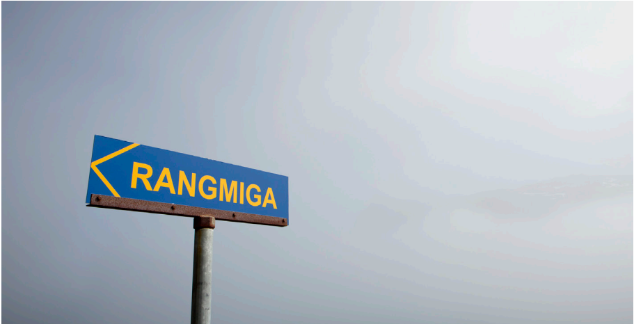
Skilti í Mjóafirði.