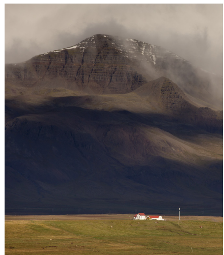
Galtarholt í Hvalfjarðarsveit.

Sérfræðingar á nafnfræðisviði Stofnunar Árna Magnússonar í íslenskum fræðum (áður Örnefnastofnun Íslands) veita sveitarfélögum og öðrum sem á þurfa að halda upplýsingar og gefa ráð varðandi nafnbreytingar býla. Á stofnuninni er enn fremur hægt að nálgast örnefnaskrár úr öllum landshlutum. Bæjanafnatal er birt á heimasíðu Árnastofnunar, www.arnastofnun.is/page/baejatal .