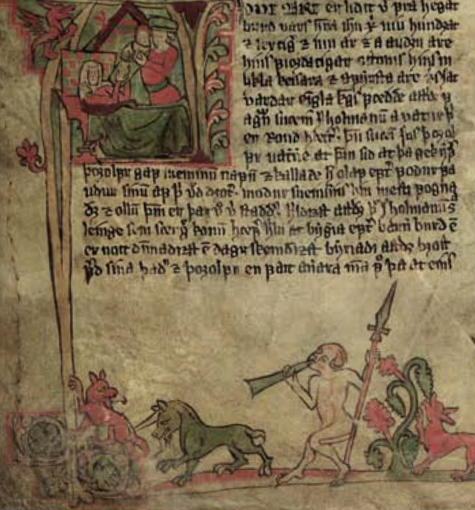
Flateyjarbók GKS 1005 fol., sem líklega var skrifuð og lýst á árunum 1387–1394, er í grunninn safn konungasagna þó jafnframt leynti í henni ýmis kvæði, t.d. elsta skráða ríman, annáll og efnis hvergi hefur varðveist annars staðar eins og Grænlendinga saga sem segir frá fundi Vinlands eða

veit viki gullu' s' i' t' a' n' a h' a' r' t' e' r' h' a' t' t' v' p' r' a' h' e' g' a' t' b' a' n' d' v' a' r' s' i' t' i' n' a' x' m' u' h' u' n' d' e' t' z' l' e' y' a' g' z' i' n' n' a' r' z' a' a' u' d' u' a' t' r' e' h' u' i' l' p' i' o' y' d' a' t' i' g' a' r' a' t' o' m' i' s' h' u' i' l' m' h' e' l' l' a' b' e' i' t' a' r' z' s' p' i' u' s' t' a' a' r' e' v' i' a' t' v' a' r' d' a' r' e' g' l' a' f' a' i' p' o' e' d' d' e' a' t' t' o' v' a' g' h' i' n' a' m' s' h' o' h' m' a' n' u' a' v' a' r' i' e' t' e' r' v' o' n' d' h' e' r' . s' i' n' s' u' a' t' s' a' l' p' o' s' a' l' p' r' u' d' i' e' a' t' s' i' n' s' i' d' a' t' p' a' g' e' e' n' s' p' o' s' o' l' p' r' g' a' p' i' e' m' i' n' u' n' a' p' p' i' z' h' u' l' l' a' d' e' s' h' o' l' a' p' e' p' t' p' o' d' u' r' p' a' u' d' u' r' s' i' m' u' a' p' p' v' d' a' e' o' e' . m' o' d' u' r' s' i' e' m' i' n' u' s' i' n' m' e' s' t' a' p' o' g' n' a' d' z' o' l' l' u' s' p' m' e' r' p' a' r' v' v' s' t' a' d' d' . h' l' o' a' s' t' a' t' t' i' b' s' i' s' h' o' l' m' i' a' n' s' l' e' m' g' e' s' i' n' s' e' r' y' b' o' m' i' h' o' e' p' h' i' l' a' t' e' r' b' i' g' u' a' e' p' t' v' a' m' b' u' r' d' e' e' r' n' o' r' t' d' i' n' a' d' i' z' t' e' d' a' g' r' s' e' o' m' b' i' z' t' . b' i' r' n' a' d' i' a' t' t' i' d' s' b' i' a' t' p' d' s' i' n' a' h' a' d' z' p' o' s' o' l' p' r' e' n' p' a' r' a' n' i' a' t' a' m' a' p' p' a' t' e' r' e' m' i'